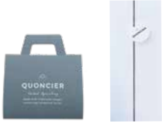
クオンシェ/バッグ クオンシェ/ボックス

北海道産の乳を使用した醗酵バターをたっぷり練り込み、昔ながらのレシピで丁寧に焼き上げたQUONオリジナル「クオンシェ」。バターの風味とリッチなピュアチョコレートとのハーモニーが際立つ、ハンドメイドの焼き菓子です。