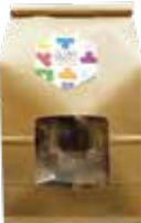
QUON ロッシェ/量り売り 内容:1g-